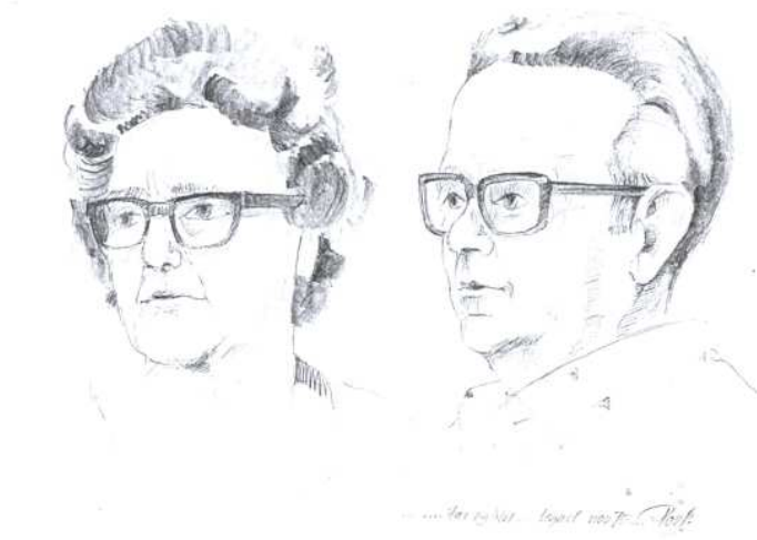
I november 1975 tegnede PD sine forældre