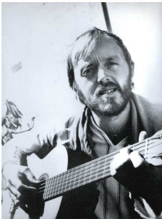
"Gamle Sange i Live"