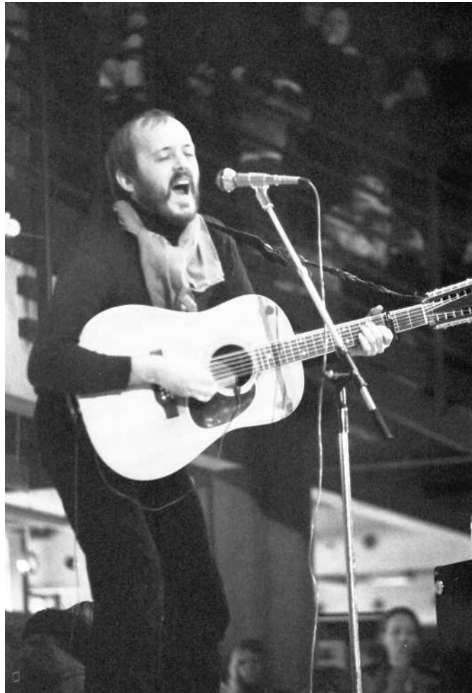
Albertslund 1979

“Det hele handler jo ikke om at synge en sang, men om at fortælle en historie.