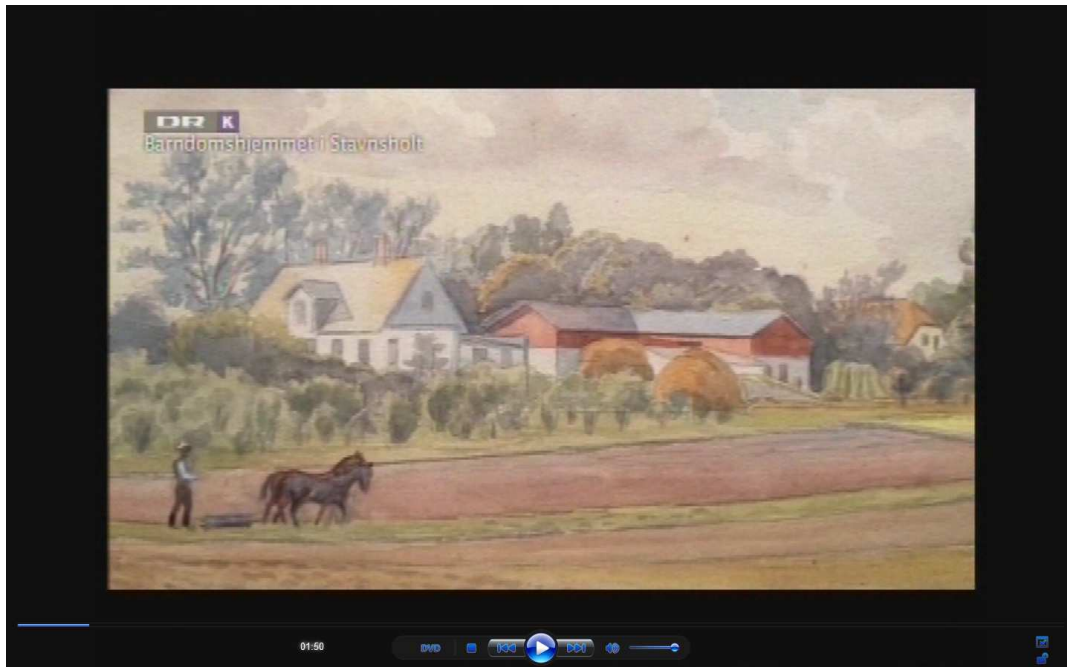
En akvarel, som PD malede senere (fra TV-udsendelsen "Danske Musiklegender" 2013)

"Det har været en lang og knudret vej. Jeg vidste ikke, hvad jeg ville. Jeg gik ud af 7. klasse - selv om der faktisk var tænkt lidt mere over min skolegang hjemmefra end som så. Jeg løb aldrig ind i en lærer, der kunne se et eller andet i mig, der kunne bruges.