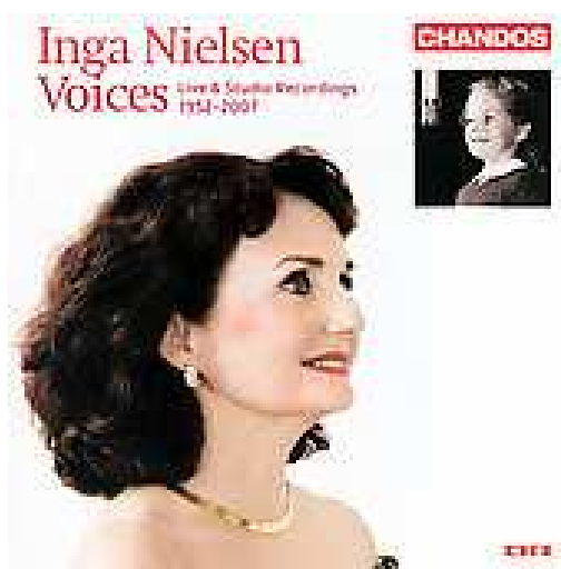
CD-2 - En retrospektiv udgivelse 1952 – 2007