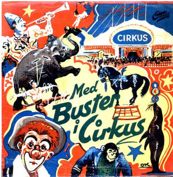
Coveret til Oktavs udgave.