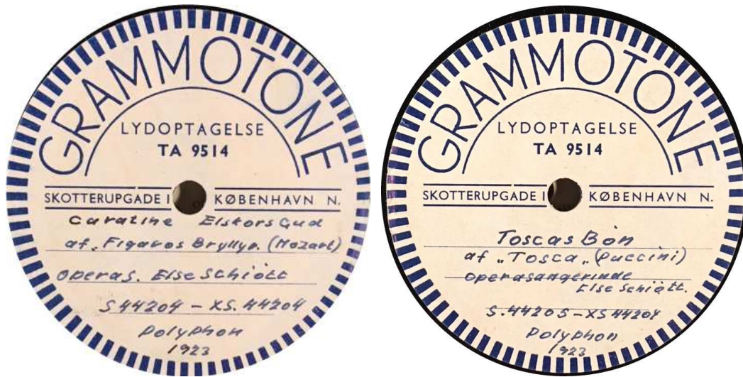
Polyphon-pladen overspillet privat.