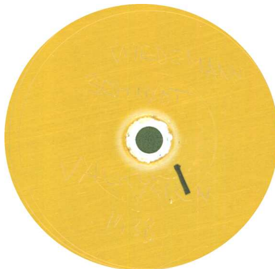
Desværre er det ikke muligt at læse etiketten, hvor oplysningerne er ridset ned.